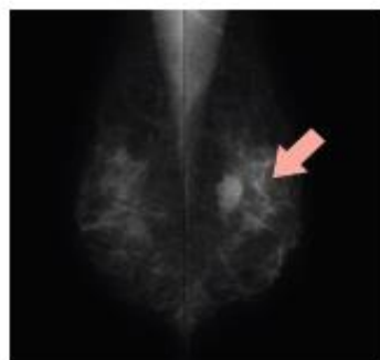
🔍 腫瘍 (MLO方向)