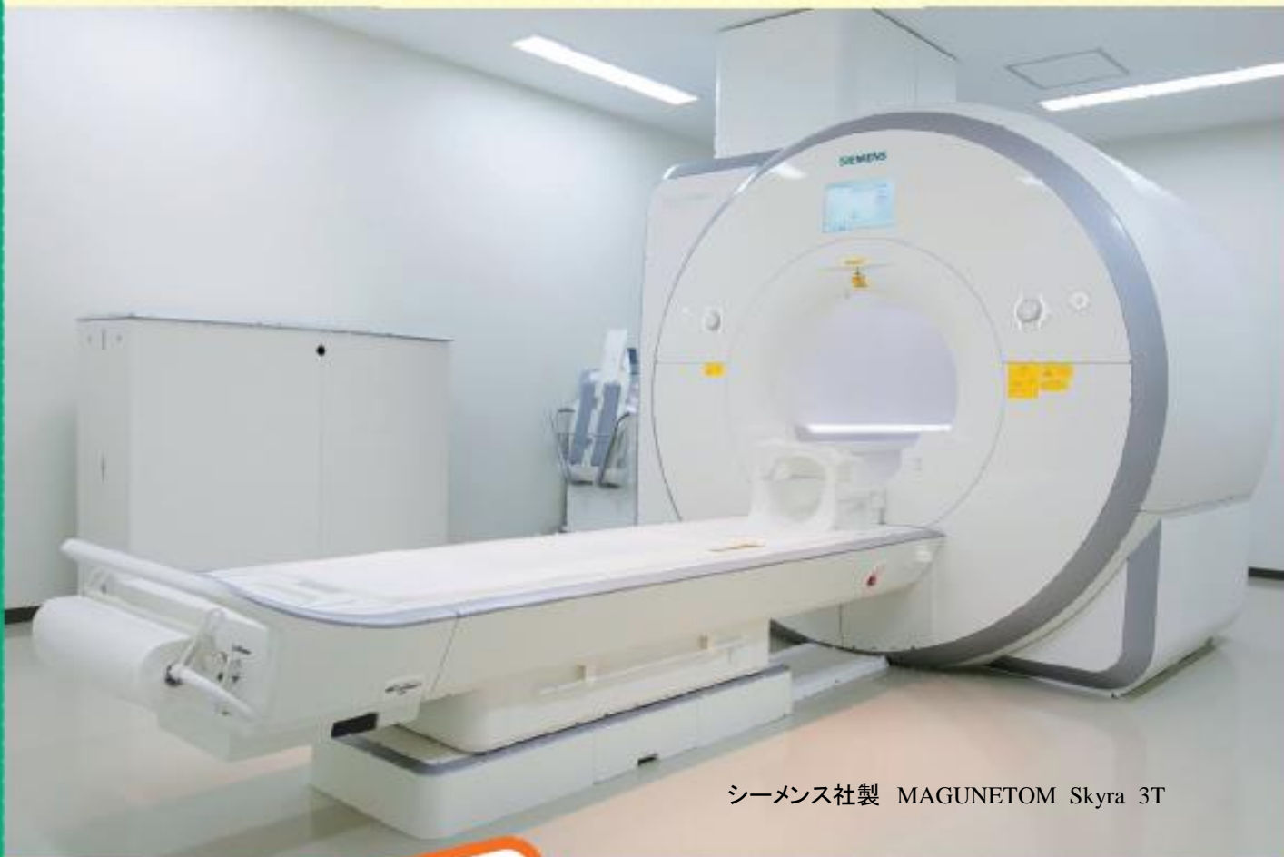
シーメンス社製 MAGNETOM Skyra 3T