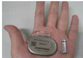
ペースメーカー リードレスペースメーカー

まず【臨床工学技士】という職種に関し軽くご案内致します。歴とした国家資格を有した医療従事者ですが在籍している医療機関に限られており総合病院や透析施設等には多いですが中小医療機関にはほぼおりません。また患者様が麻酔かかった意識の無い状態で従事している業務が大半なので知らないのも当然かと思えます。そこで、今回私どもの業務内容の一部を紹介し少しでも理解や興味を持って頂けたら幸いです。めまい等の症状の原因が徐脈（一般的に心拍数が50回／分以下）であった場合、『ペースメーカー』が植え込まれる事があります。今回はその『ペースメーカー』に臨床工学技士が携わっておりますので、私どもの職種ならではの工学的目線にて紹介致します。