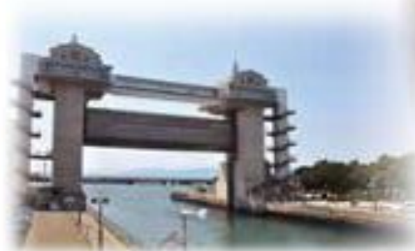
沼津港大型展望水門 「びゅうお」