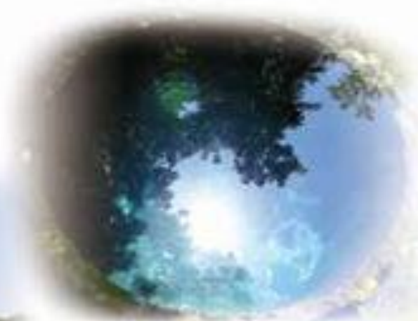
駿東郡清水町 「柿田川湧水」