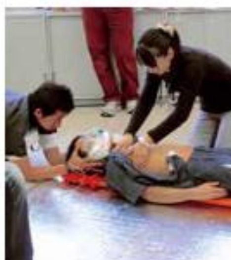
JPTEC研修 (病院前外傷観察 処置標準化プログラム)