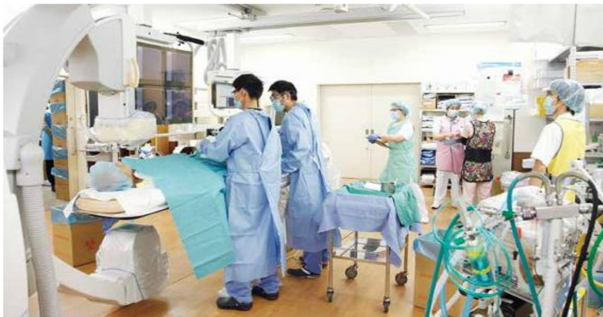
心臓血管カテーテル室

地方循環器病センターとして、24時間365日患者さまを受け入れ、緊急手術や緊急心臓カテーテル検査などが実施できる体制を整えています。生命の危機的状況にある患者さまを救うために、勉強会やBLS研修に力を入れているため、的確な処置を瞬時に判断・実施する能力を身につけることができます。