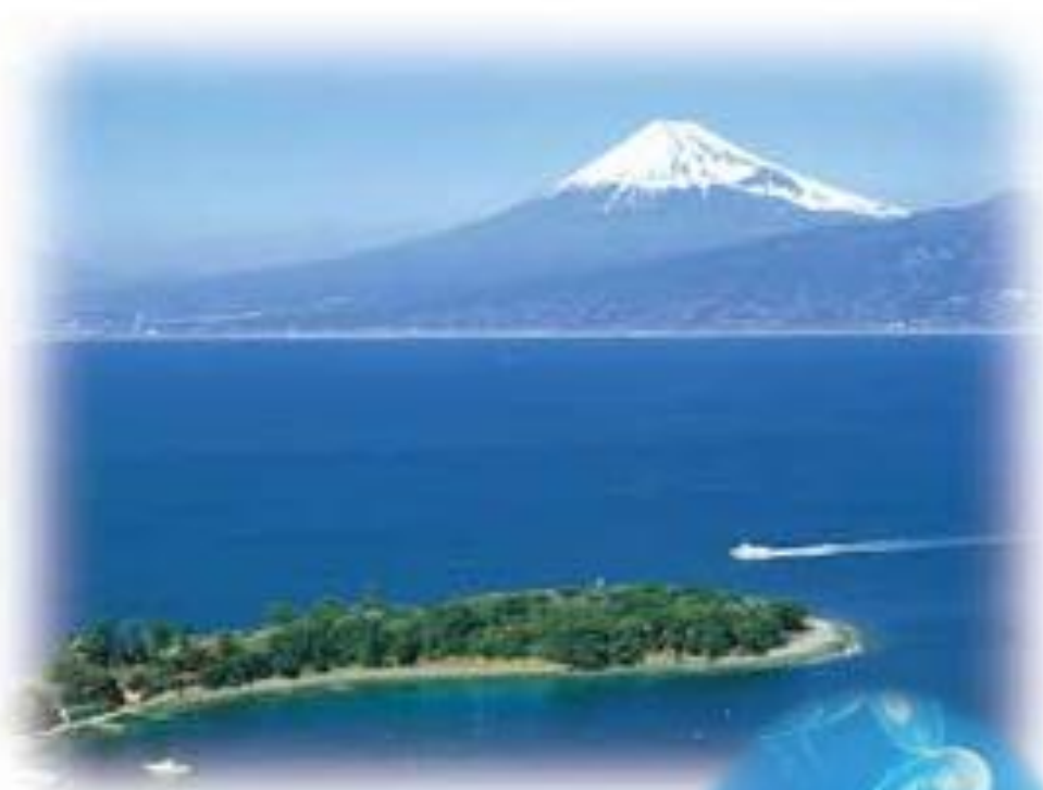
日本屈指のダイビングスポット 「大瀬崎」