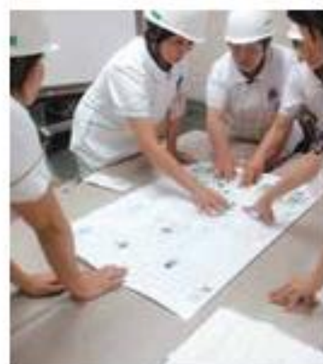
災害研修 (エマルゴ)