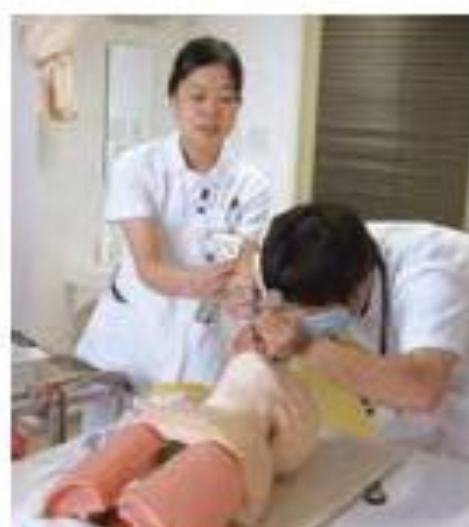
ICLS研修 (蘇生トレーニング)