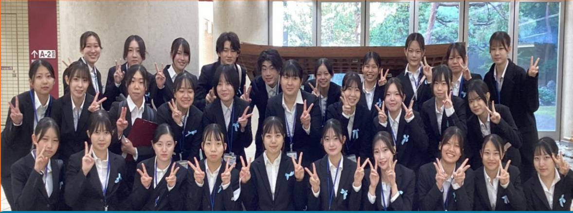
参加した 2年生 集合写真です